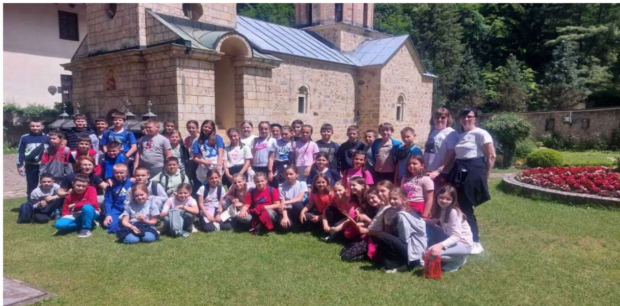
Ученици 2. Разреда, у оквиру једнодневне екскурзије, 23.05.2025.године боравили су Новом Саду и Сремској Каменици а обишли су и Петроварадинску тврђаву.