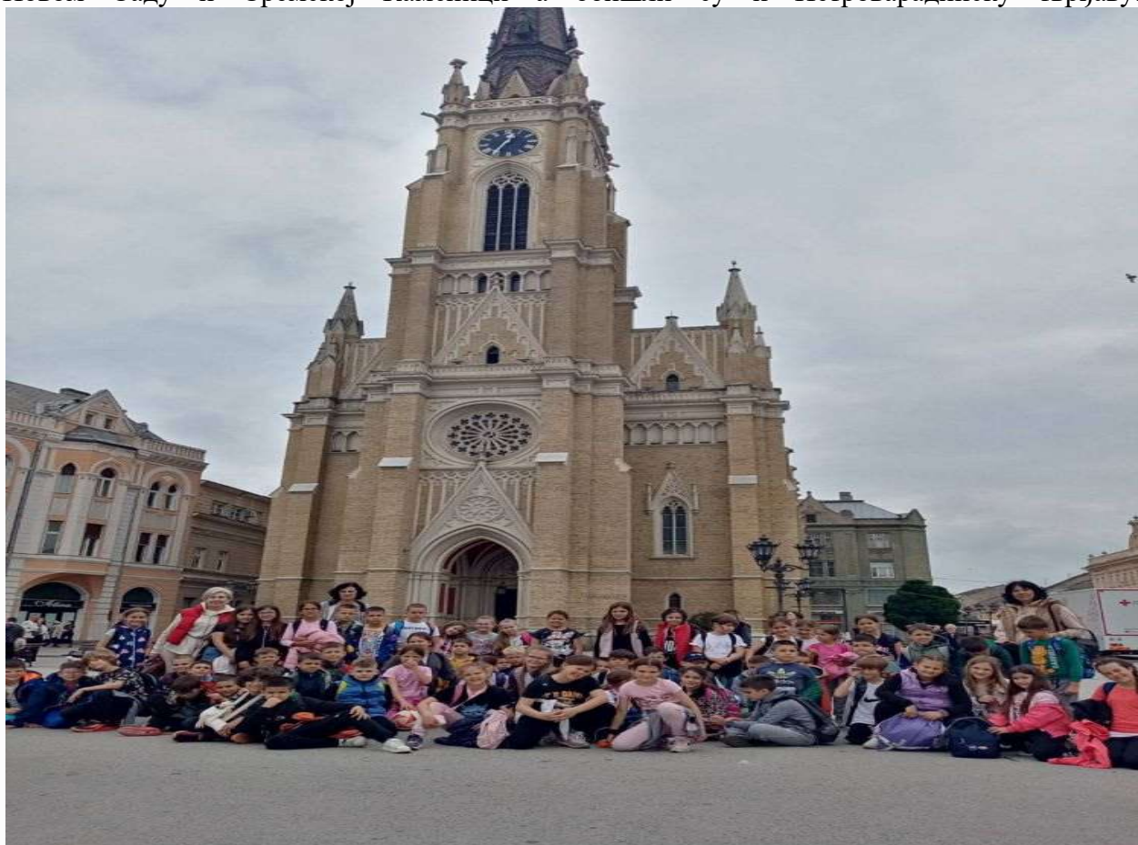
И наши мали „прваци“ су у среду 21.05.2025. године били на својој првој заједничкој екскурзији.Програм екскурзије обухватао је обилазак Сомбора и